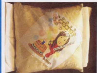
Morty Shop產品十分多元化，從水杯、水壺、領夾、火機，到金屬板畫，一應俱全。