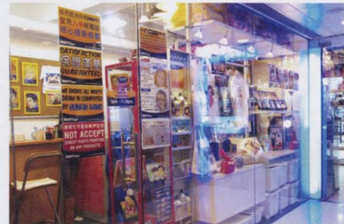
店舖位於銅鑼灣一商場內，雖然位置未算開揚，但生意不俗，目前每月約有5萬元盈利。

租金：$50,000 入貨：$4,000 人工：$10,000 營業額：$114,000 盈利：$50,000